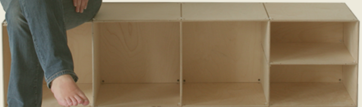
Platten natur in groß und klein