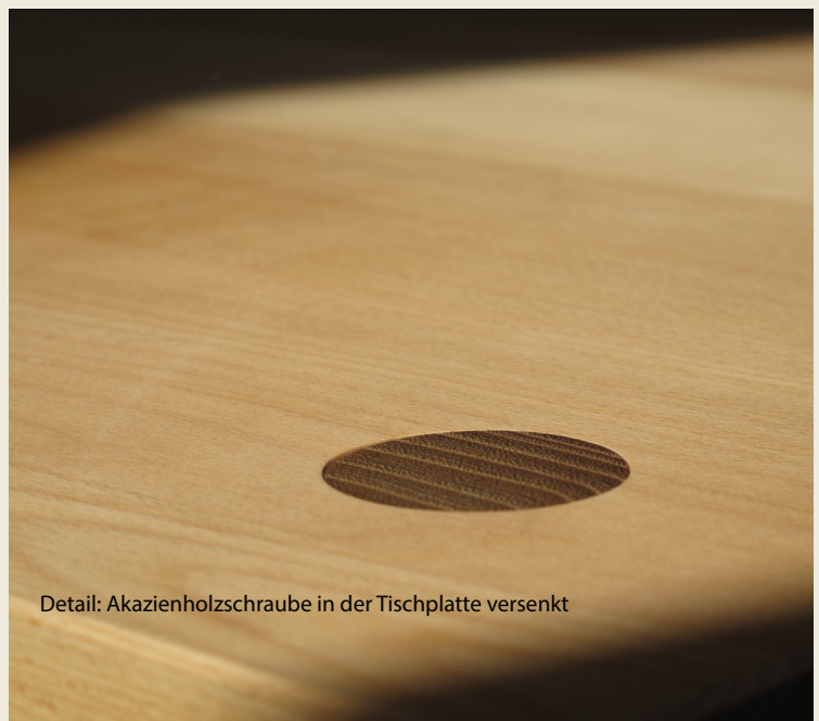
Detail: Akazienholzschraube in der Tischplatte versenkt